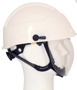
jugulaire 4 points avec mentonnière (en standard).